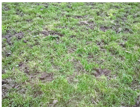
Prairie dégradée suite au pâturage peu adapté aux conditions pédo-climatiques