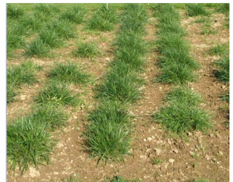
Testage de variétés de Ray—Gras anglais par Agra Ost

Utiliser des espèces et variétés agressives