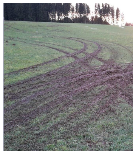
Prairie dégradée suite au passage de machines lourdes sur sol peu portant