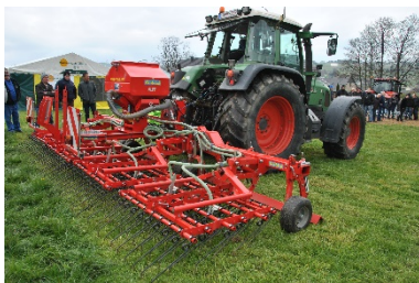
Sursemis à la volée avec herse étrille