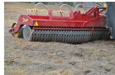
Sursemis en lignes avec herse à disques